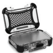
Aluminum Panel Ensemble de panneaux en aluminium