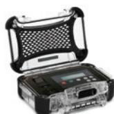
Custom Panel Panneau personnalisé