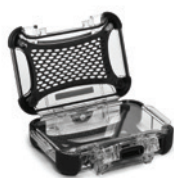
Lexan Panel Ensemble de panneaux en Lexan