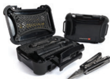
Custom Foam Mousse personnalisée